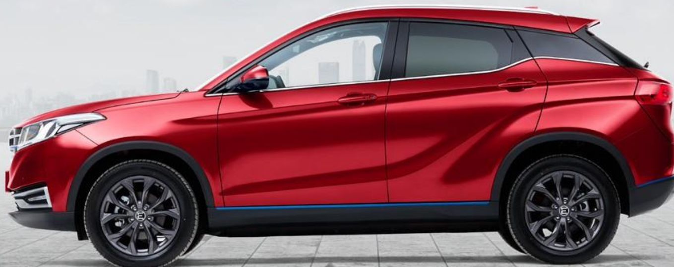
Красный – металлик