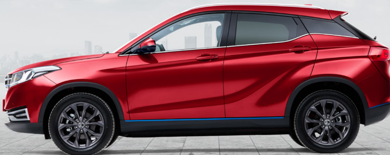
Красный – металл