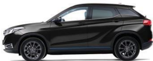
Черный – металлик