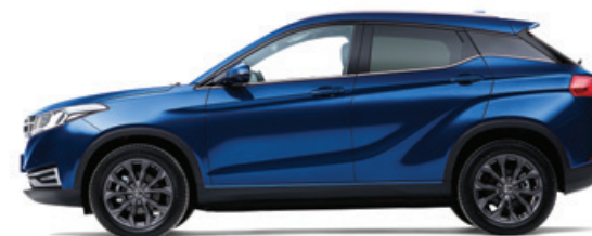
Синий – металл