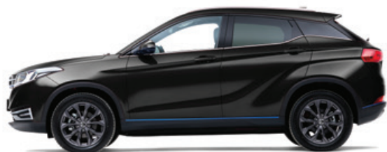
Черный – металл