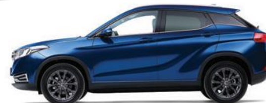
Синий – металлик